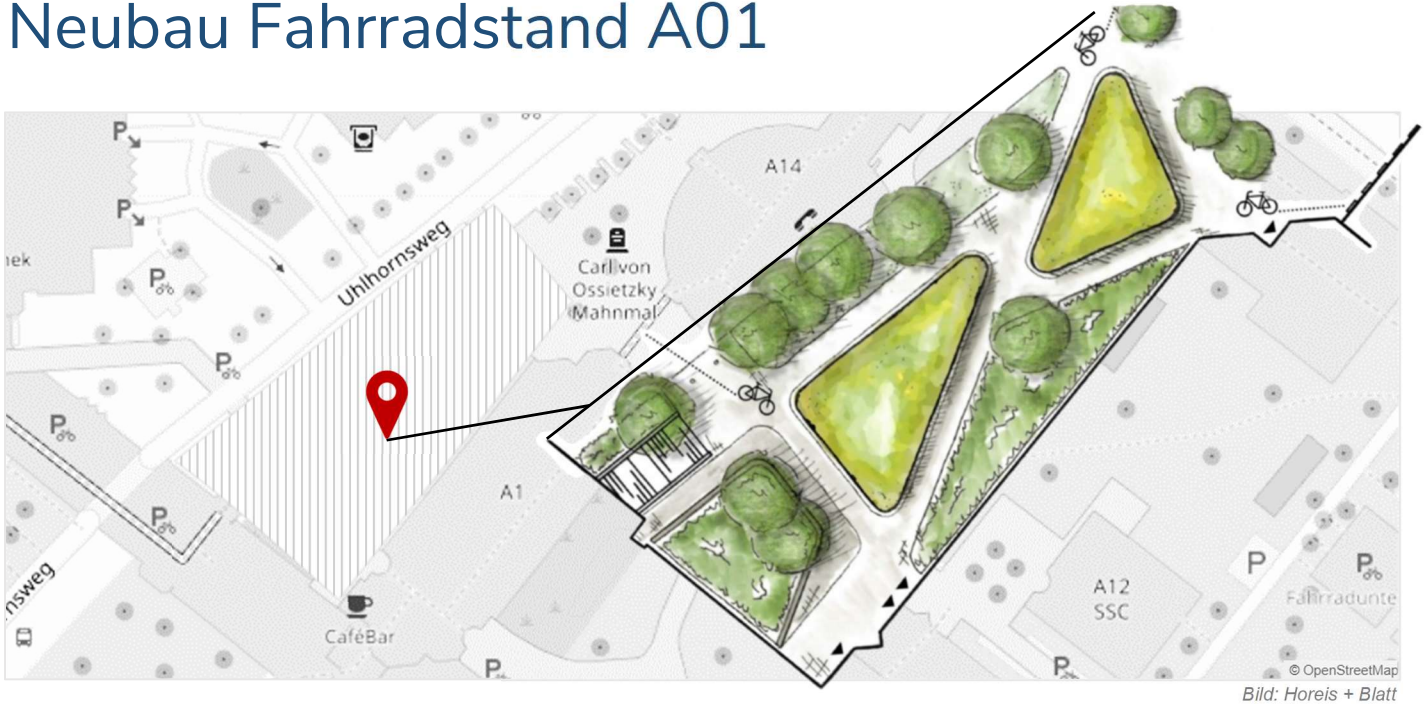
© OpenStreetMap Bild: Horeis + Blatt